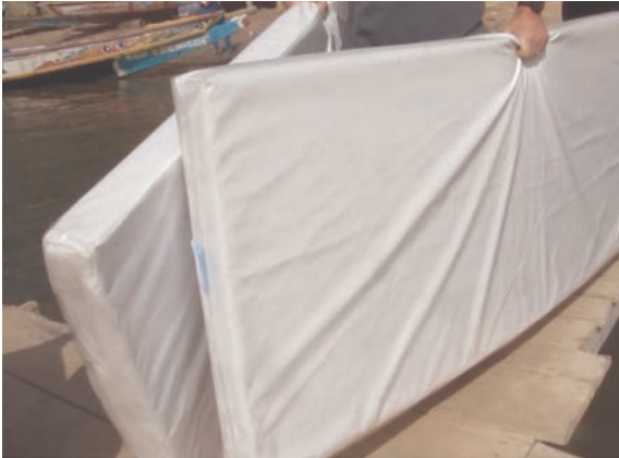
Réalisation de housse de protection matelas au CVD avec Diego