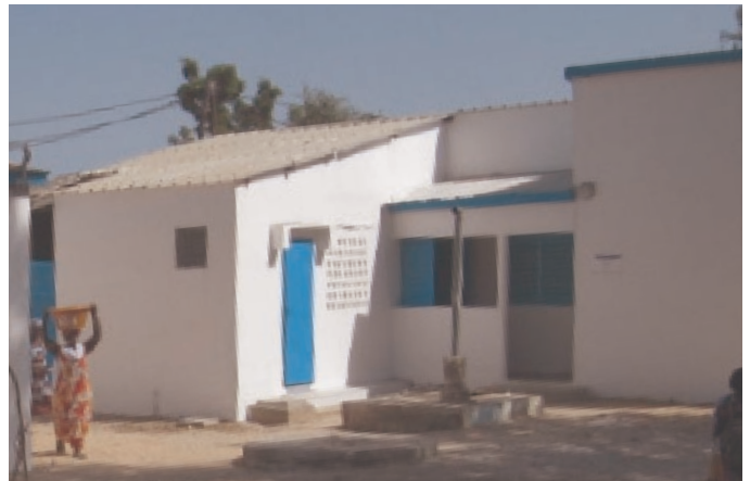
Maternité - Entrée secondaire