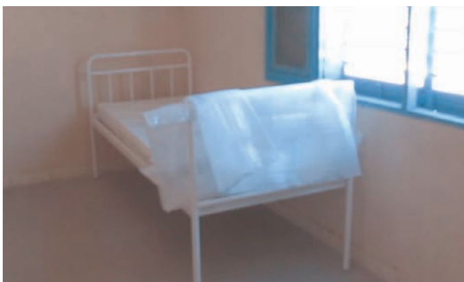
Suite de couche