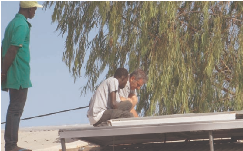
10 Panneaux solaires