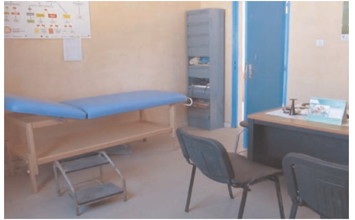
Bureau ICP, Consultation