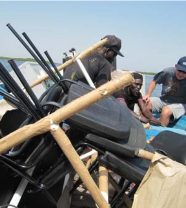
Don matériel médical