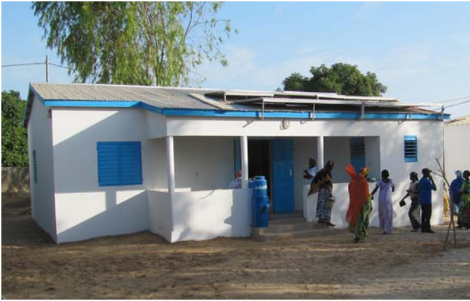
Bâtiment de médecine générale