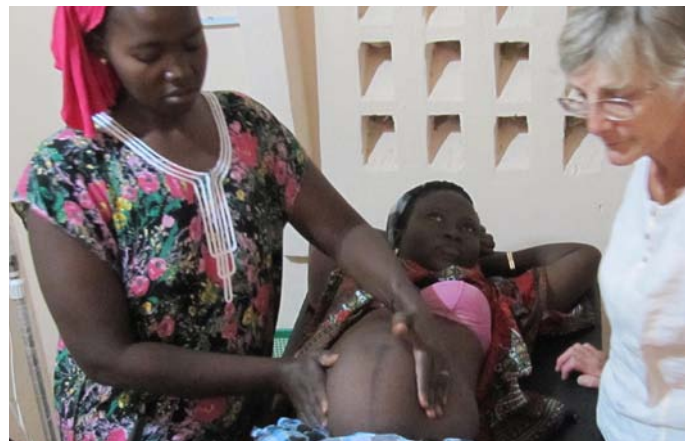
Prise en main du Doppler foetal