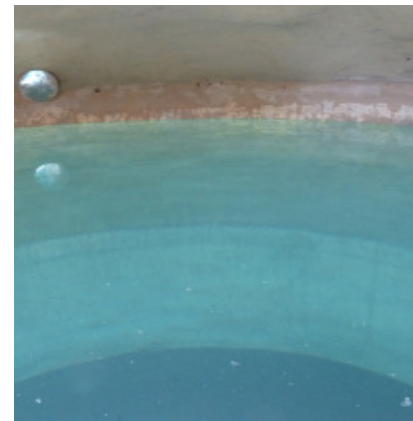
Récupérateur d'eau de pluie de 10m 3 (Première étape dans le cadre de la rénovation du Poste de santé initiée en Juin 2013,