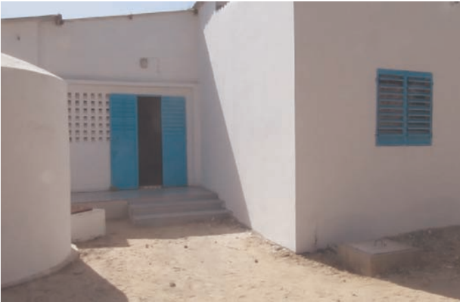
Maternité - Entrée principale et REP