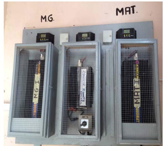
Onduleurs et régulateurs solaires