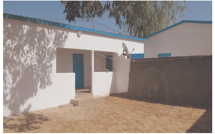
Logement Sage Femme