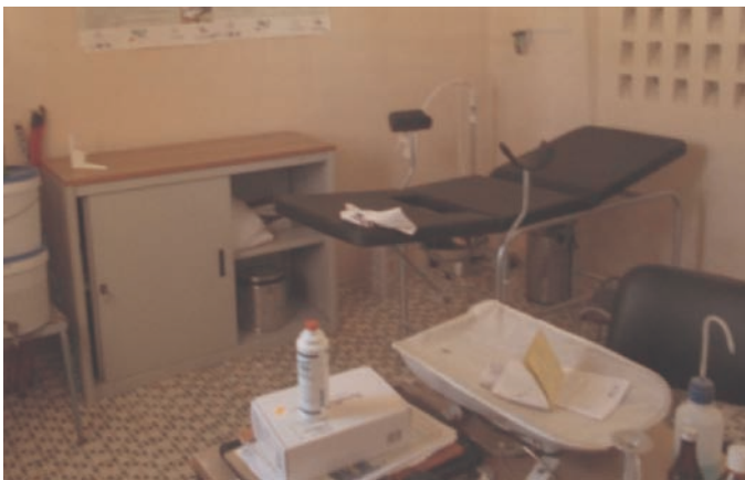
Salle de consultations et planning familial