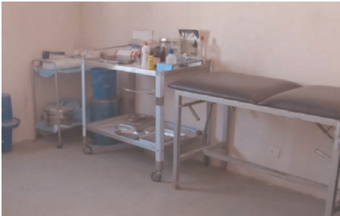
Salle de soins