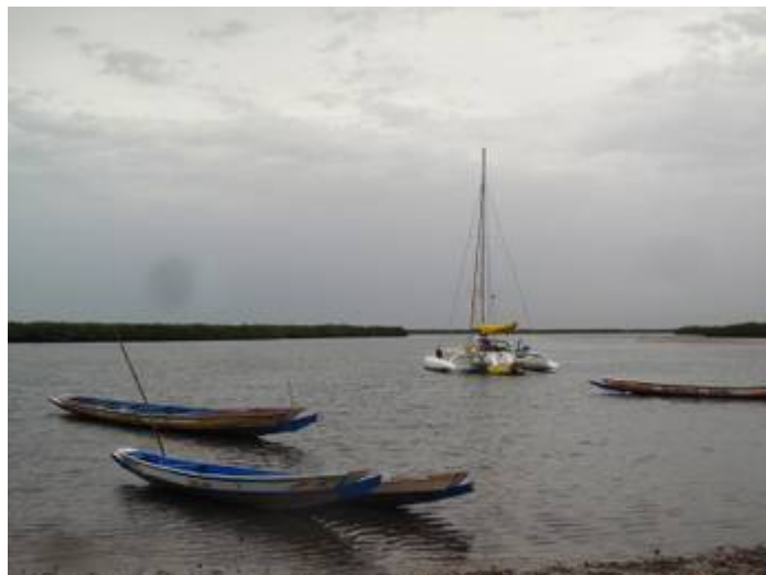
Figure 1 Yobalema au mouillage à Falia

Pendant tout le séjour nous resterons au mouillage en face de l'hôtel Niominka, pour ne pas « séparer » la flotte, Criquet et Morgane ne pouvant venir devant Falia du fait de leur tirant d'eau. De plus, une partie de l'équipe évoluera à Niodior et Dionewar, il n'est donc pas forcément intéressant que tout le monde soit devant Falia. Néanmoins, on sentira bien que la population se demande pourquoi Yobalema ne vient pas jusqu'à eux... Nous corrigerons cela le jeudi 21 où nous passerons la nuit devant le village avant de récupérer le matériel dentaire.