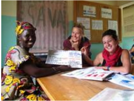
Figure 4: Ara matrone, en formation avec VSF