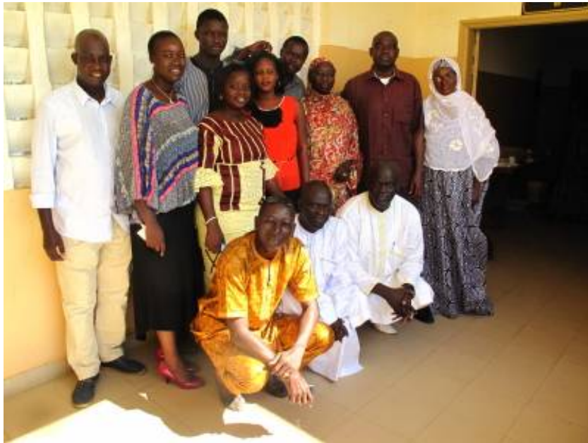
Figure 10: l'ensemble des ICP du Saloum et la direction du Centre de Santé

Un tour de table est effectué pour que chacun puisse s'exprimer. Pas de réactions sur le changement de politique , contents, pas contents, je n'en saurai rien, mais c'est maintenant une affaire entendue.