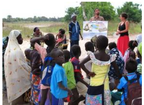
Figure 6: causeries en participation avec l'ASC

Trois causeries sont organisées pour les adultes : maladies respiratoires et tuberculose, paludisme, planning familial avec les femmes. Pour chaque causerie, les soignants locaux s'impliquent fortement. Une causerie sur les pathologies chroniques devait être organisée, suite à des questions posées sur l'arthrose pendant la causerie Infections