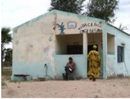
Figure 3 case de Falia