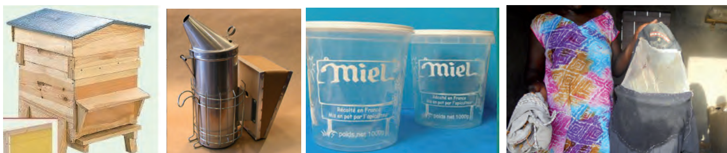
Ruches, enfumoir, pots plastiques , vareuse

Les pots en plastiques et les autres produits seront achetés par VSF en France et livrés à Diogane