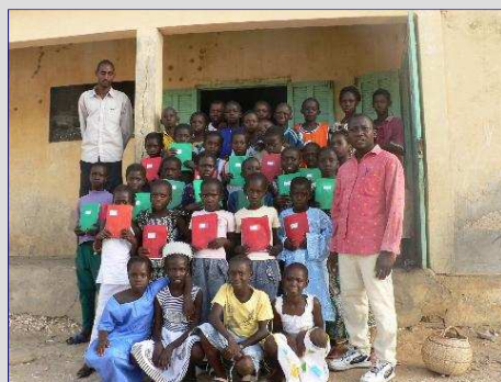
nouveau partenariat scolaire avec l'école de Moundé