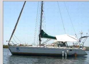
Ibaïa : un feeling 35 équipé grand large

O n doit en convenir, cette deuxième mission VSF 2006 dans le Siné Saloum ne s'annonçait pas sous les meilleurs auspices : avec la défection du médecin et de l'infirmière, c'était tout le volet médecine générale qui nous faisait défaut et cela représentait un sérieux handicap au départ. Pourtant, après quelques hésitations bien compréhensibles, le bureau de VSF décidait de répondre simplement à ses engagements à l'égard des populations du Siné Saloum : cette mission aurait lieu et bien nous en a pris car comme on va le voir, ce fut une expérience d'une grande efficacité et d'une richesse humaine extraordinaire sur le terrain.