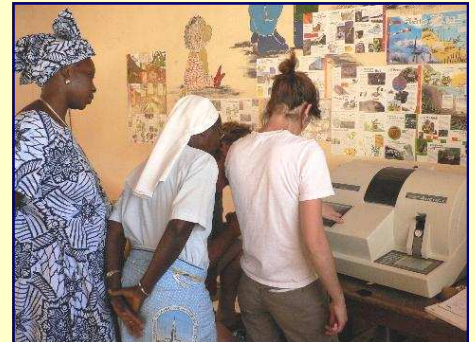
lunetterie : la meuleuse indispensable mais fragile