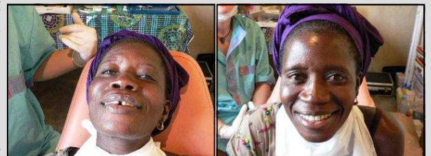
avant et après